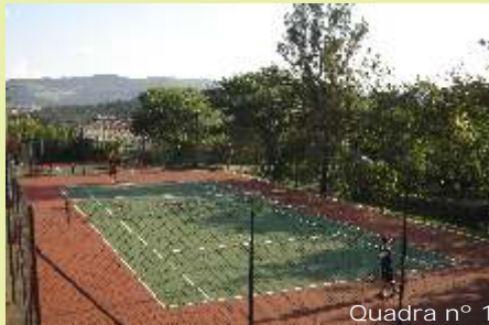
Melhoria - foram instalados bebedouros ao lado dos portões de acesso às quadras

com o esporte, agende uma aula com o professor e deixe o tenista que existe em você brilhar nos eventos da Sar-10! Contamos com sua presença.