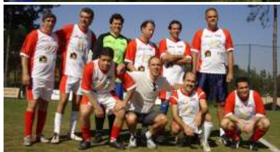
Equipe Master Sar-10 "campeã do 1º Torneio Inter-alfas do Residencial 10 em 2006"