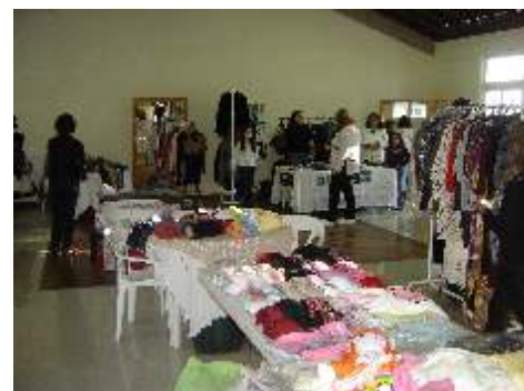
Variedade de produtos novos