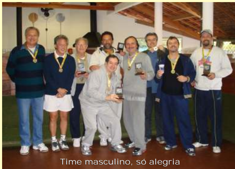
Time masculino, só alegria