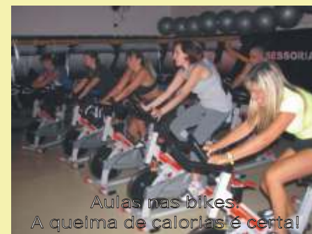
Aulas nas bikes. A queima de calorias é certa!