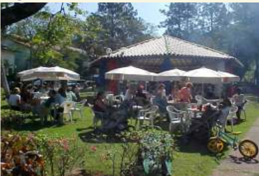
...O clima foi totalmente familiar. Pais e filhos tiveram um dia inesquecível...