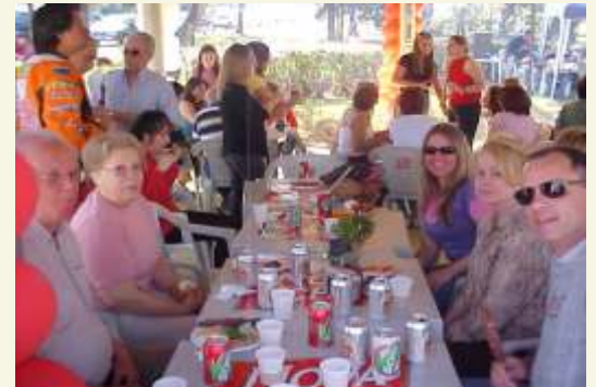
...Confraternização, descontração e diversão deram um toque especial ao evento...