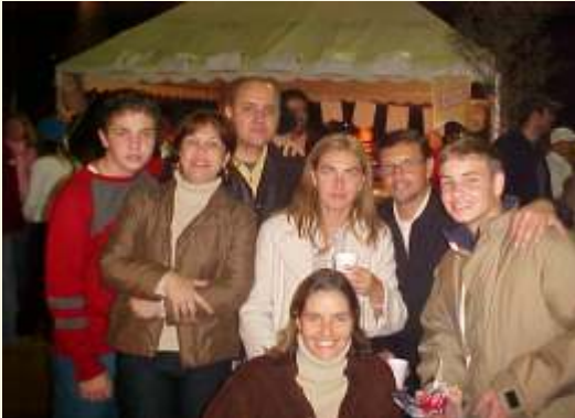
Alegria e descontração, marca registrada Sar-10