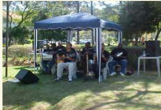
...A festa dos papais foi animada com música ao vivo, amor e alegria...