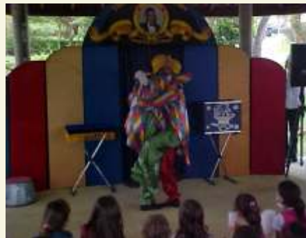
Muitas risadas com os palhaços...