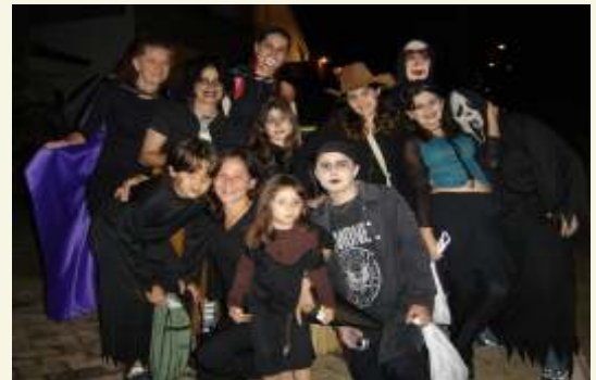
Muitos "monstros" fizeram a tradicional arrecadação de doces