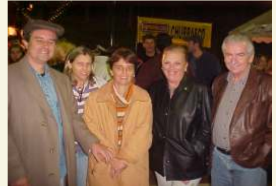
A elegância marcou presença durante a festa