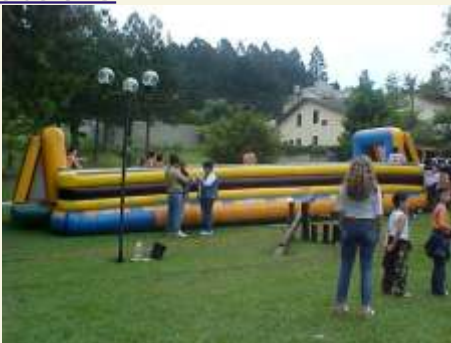
Brinquedos infláveis, um colorido especial