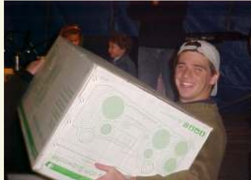
Prêmios valiosos foram distribuídos nos bingos