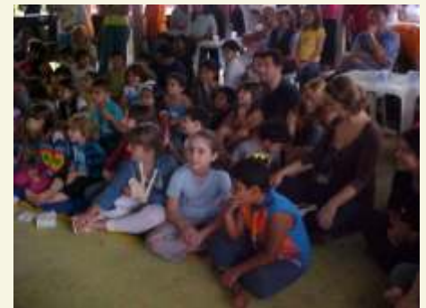
Truques de mágicas encantaram os baixinhos