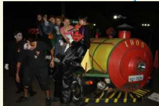
A festa de Halloween foi muito animada