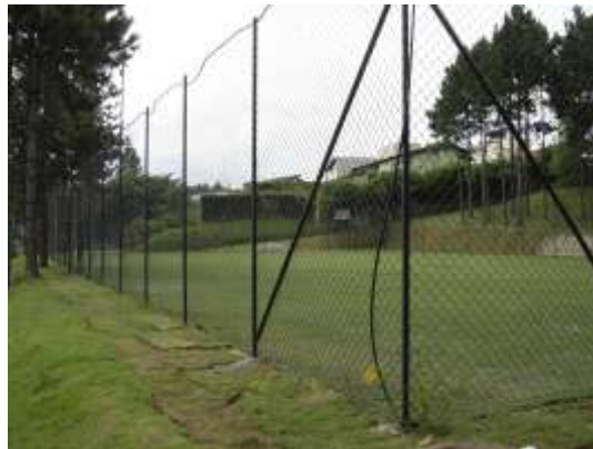
O gramado irrigado do campo de futebol está quase concluído