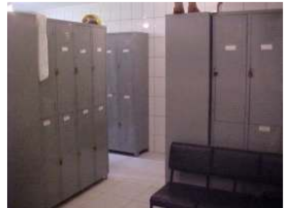
Os novos vestiários para os funcionários já estão em uso