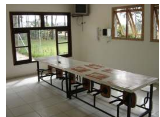
O refeitório, novinho, já está em funcionamento