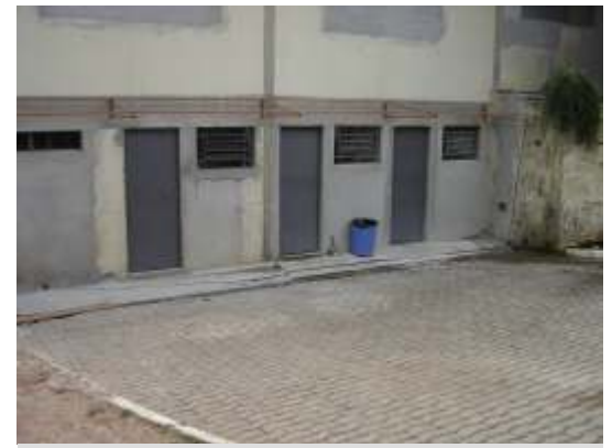
Estão prontas as duas salas de almoxarifado e uma de informática