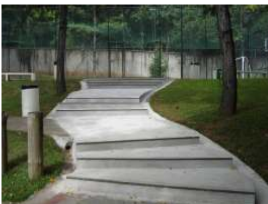
Escada para acesso às quadras