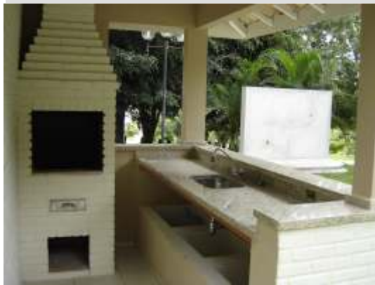
O espaço reservado para o churrasco está pronto...