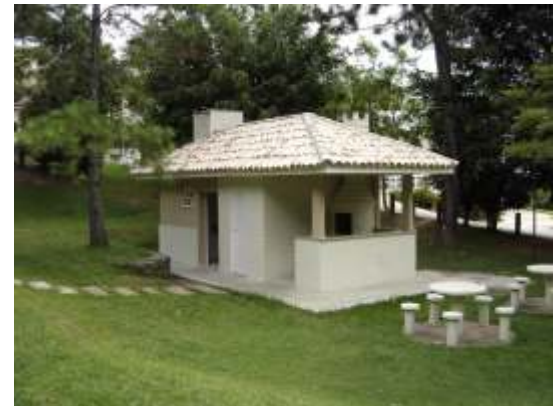
...Com novo telhado e pintura