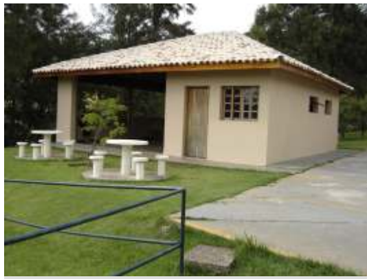
A churrasqueira do tênis foi adequada às exigências