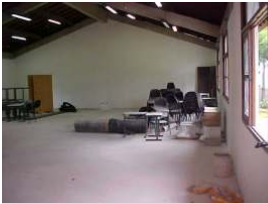
Vista interna do salão social