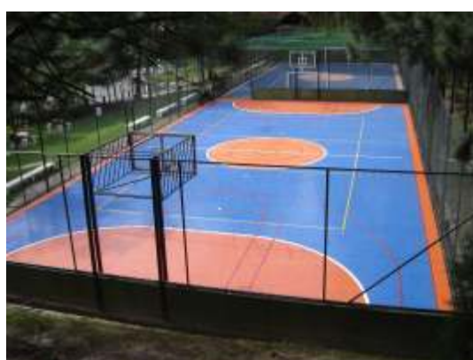
A quadra poliesportiva recebeu novo piso